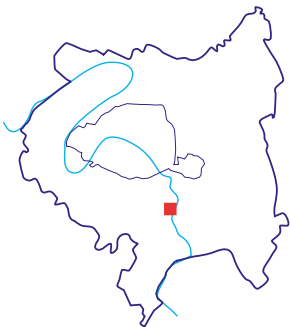
Site «Inventons la Métropole du Grand Paris», Pôle Gare des Ardoines

ZAC Gare des Ardoines 94400 Vitry-sur-Seine